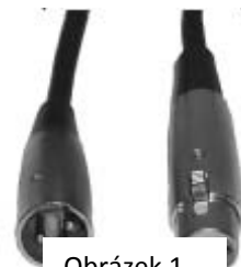
Obrázek 1 figure 1

standardního 3pinového XLR konektoru (Obrázek 1). Doporučujeme použití kabelů Accu Cable DMX. Vyrábíte-li vlastní kabely, použijte standardní stíněný kabel 110-120 Ω (tento kabel lze zakoupit téměř v každém obchodě s osvětlovacími potřebami). Vaše kabely by měly být zakončeny samcem konektoru XLR na jedné straně a samicí konektoru XLR na straně druhé. Pamatujte také na to, že DMX kabel musí být řetězen a nelze jej dělit.