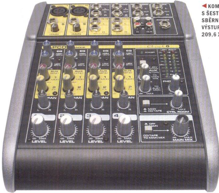
◀ KOMPAKTNÍ MIXÁČEK S ŠESTI VSTUPY, DVĚMA SBĚRNICEMI A DVĚMA VÝSTUPY MÁ ROZMĚRY 209,6 X 266,7 X 66,7 MM

vřelost, lehkým ubráním zmenšil případnou přílišnou energii ve spodním pásmu. Vše bez ovlivnění středů. Impedančně si basa s mixem dobře rozuměla. Kvituji existenci návratu auxu, stejně jako možnost poslat ho do monitorové sběrnice. Dobrý je i plnohodnotný fantom (na některých mini mixech chybí nebo je jen 12 V). Pozitivní jsou i kvalitní Neutrik XLR a kovové jacky. XLR ovšem nejsou combo, takže levné mikrofony s pevnou šňůrou zakončenou jackem nepripojíte, respektive pouze do nástrojového vstupu, který je ale vysoko-