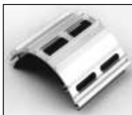
L4.79219.E Top cover compl. Deckel kpl.