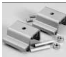
L4.79420.E Stirrup bracket Bügelager