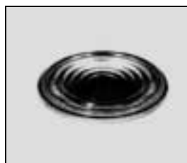
L4.79207.E Fresnel lens Stufenlinse