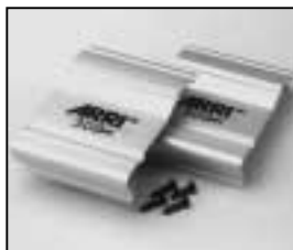
L4.79246.E L4.79246UE (USA) Set of side panels Set Seitenbleche