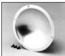
L4.79237.E Reflector Reflektor