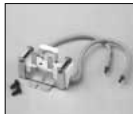
L4.79326.E Lamp holder Lampenfassung