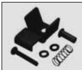
L4.79244.E Top latch Verschlußklaue