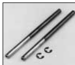
L4.79214.E Focus support rods Gleitstange