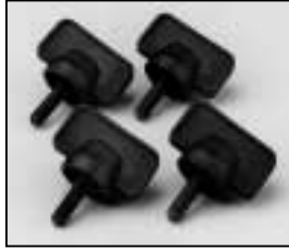
L4.79436.E Set of locking knobs Satz Arretierschrauben