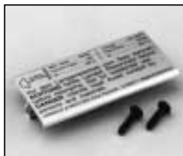
L4.79212.E L4.79212UE (USA) Bottom plate Bodenblech