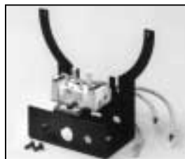
L4.79253.E Lamp holder + lamp carriage compl. Lampenfassung + Fassungsträger kpl.