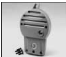
L4.79210.E Rear casting Rückteil