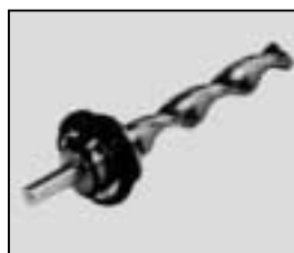
L4.79248.E Focusspindle Fokusspindel