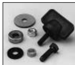
L4.79435.E Mounting set for stirrup Bügelbefestigungssatz