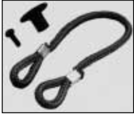
L4.79242.E Cable tie set Halteleine Set