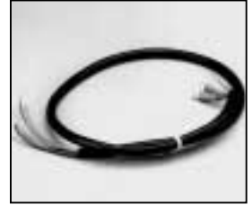
L4.79274.E L4.79274UE (USA) Head to switch cable Kabel (bis zum Schalter)