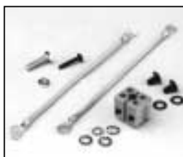
L4.79434.E Kunststoff / plastic L4.79434UE Keramik / ceramic Terminal block Kabelklemme