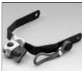
L4.79110.E Stirrup complete Haltebügel komplett