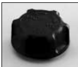
L4.79036.E Focus knob Fokusknopf