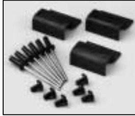
L4.79240.E Set of accessory brackets Set Torhalter