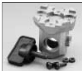
L4.77145.E 16 mm stirrup socket Hülse für Bügel