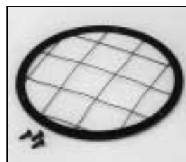
L4.79168.E Wire guard Schutzgitter