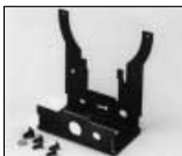
L4.79325.E Lamp carriage Fassungsträger