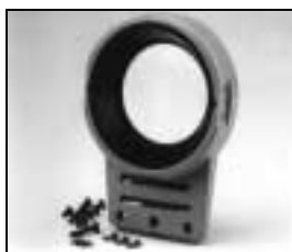
L4.79208.E Front casting Frontteil

NOTE: WHEN ORDERING QUOTE PART NUMBER BEMERKUNG: BEI BESTELLUNG IDENT.-NR. ANGEBEN