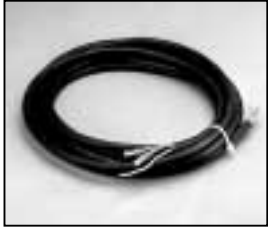
L4.79228.E L4.79732UE (USA) Mains cable Netzkabel