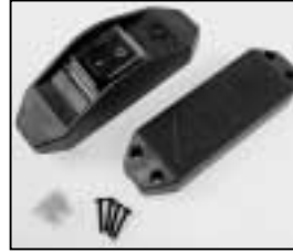
L4.77157.E Inline switch complete 110-240 V Schnurschalter komplett