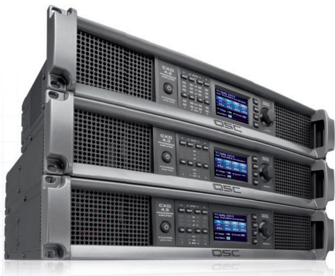
CXD pro instalace