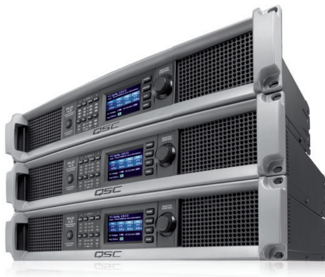
PLD pro touring a mobilní aplikace

Tyto dvě nové řady nadobro změní váš pohled na zesilovače. Výkonné, neuvěřitelně flexibilní a vysoce účinné DSP zesilovače řady PLD a CXD v sobě spojují revoluční technologii, legendární spolehlivost výrobků QSC a samozřejmě i vynikající zvukovou kvalitu. Se zesilovači se můžete seznámit podrobněji na QSC.com .